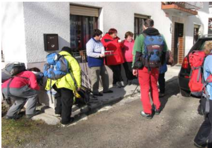
Slika 12: Vzpon proti Ledinam